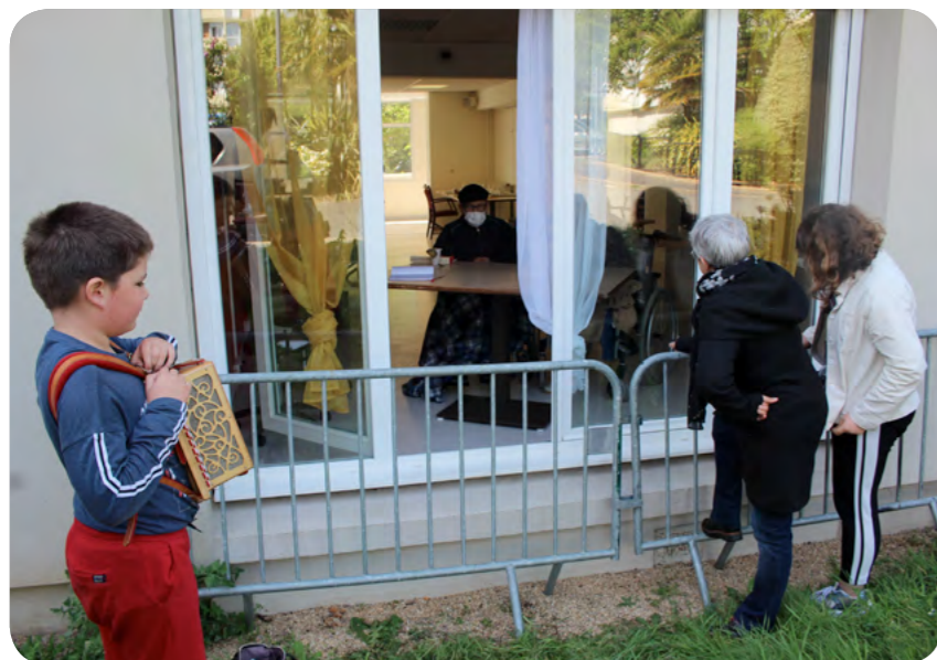
Les visites ont repris au foyer Paul Hernot, parfois même accompagnées de quelques notes de musique !