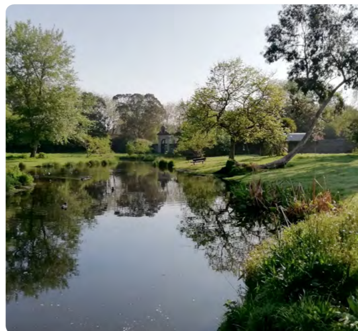
Les espaces verts de la Ville ont besoin d'un entretien régulier, les équipes se préparent à retourner sur le terrain.